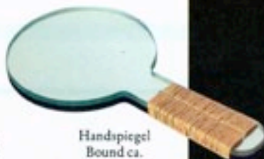
Handspiegel Bound ca. 320 Fr. von Grain Design, mit Hanf- schnüren umwickelt